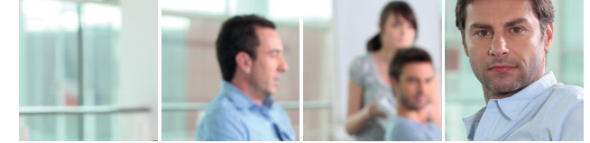
Beruf. Eingliederung für Menschen mit gesundheitlicher Einschränkung