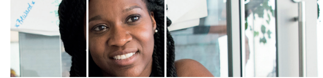
Bewerbung mit Einzeltraining für Menschen mit Migrationshintergrund