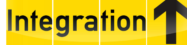
Deutsch lernen bei Peters! – mit telc-Sprachprüfung oder DTZ zu B 1