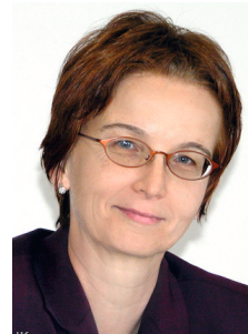
Ansprechpartnerin: Irmgard Forkel

Weitere Informationen erhalten Sie telefonisch unter 09221 605 79-0 und auf unserer Homepage unter www.peters-bg.de/kulmbach