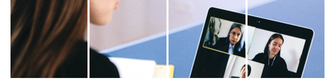
Individuelles Persönlichkeitstraining für den berufl. Wiedereinstieg