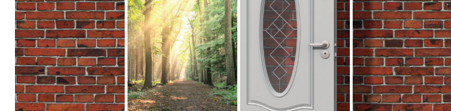
Persönlichkeitstraining für Menschen mit Vermittlungshemmnissen